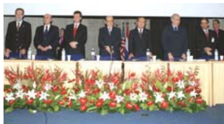
Sessão de abertura do Gastrão

A solenidade de abertura foi marcada por uma discussão sobre questões das escolas médicas e a situação econômica