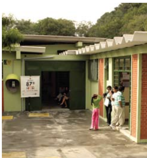
A FFM já administra alguns equipamentos de saúde da Prefeitura de São Paulo. Abaixo, a AMA São Jorge, inaugurada em maio passado. Ao lado, a AMA Jardim Peri-Peri, que também faz parte da Microrregião do Butantã/Jaguareé.

No planejamento inicial, que contempla os três primeiros anos de vigência do contrato de gestão, o gerenciamento das unidades de saúde da Microrregião será assumido progressivamente, em etapas sucessivas e complementares. No âmbito assistencial, a intenção é articular as unidades de saúde em rede e com resolutividade, ampliar a cobertura da estratégia de Saúde da Família, aumentando o número de equipes, implantar equipes multiprofissionais para formar Núcleos de Apoio à Saúde da Família (NASFs) e equipes de saúde bucal na maior parte das UBSs. Estão previstas ainda a criação de um Centro Diagnóstico Especializado em Cardiopneumologia, a ampliação das atividades do Ambulatório de Especialidades Jardim Peri-Peri e a reorganização da assistência em saúde mental, visando a estruturar um sistema de referência de contra-referência na Microrregião integrado ao Hospital Universitário e ao Hospital das Clínicas da FMUSP. O resultado esperado é a integração efetiva dos níveis de atenção, garantindo o acesso e a qualidade na prestação de serviços da saúde à população.