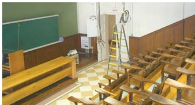
Ao lado, à esq., o anfiteatro da Fisiologia. Acima, as obras no Instituto Oscar Freire. Ao lado, à dir., os elevadores do prédio da FMUSP após a reforma.