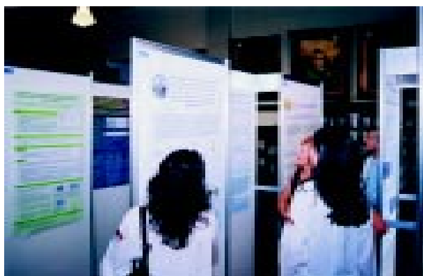
Exibição de pôsteres chamou a atenção dos participantes