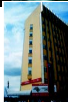
O funcionamento do Hospital será gradativo.