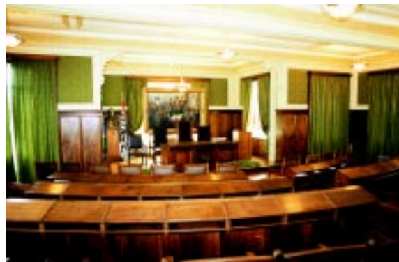
A Sala da Congregação, totalmente restaurada, foi entregue à comunidade da FMUSP em março.