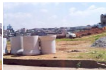
Local das obras do hospital, na região de Sapopemba.