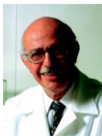
Dr. Adib Jatene

No dia 7 de abril - Dia Mundial da Saúde - o dr. Adib Jatene foi laureado com o Golden Hippocrates, prêmio internacional oferecido anualmente para dez médicos que se destacam no cenário mundial das ciências médicas. O prêmio foi criado pelo Departamento Internacional do Horev Medical Center, de Haifa, em Israel. Este ano, a entrega aconteceu em Moscou.