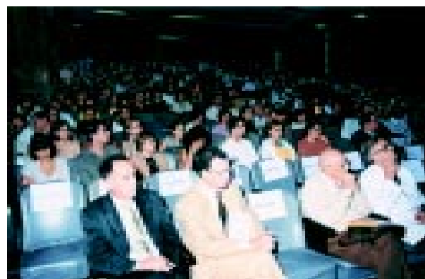
Público superou as expectativas dos organizadores