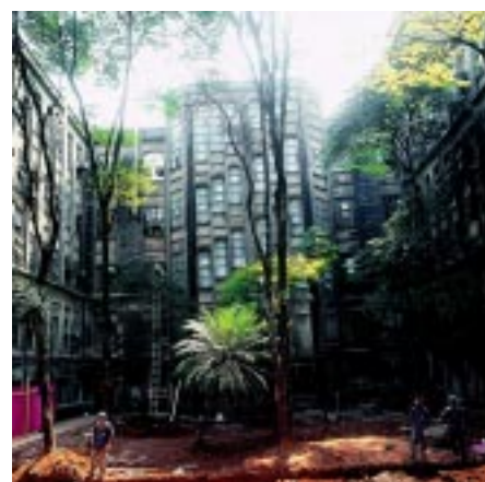
As obras seguem em ritmo acelerado.

as obras vão avançar para o primeiro andar, Sala da Congregação, pavilhão de serviços, Biblioteca e outros pontos importantes da Faculdade. Mais informações sobre as reformas estão na pág. 12.