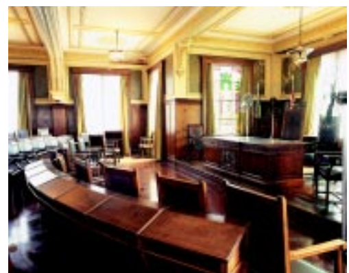
Nas duas fotos acima, aspectos da reforma do embasamento, que j  est  bastante adiantada. Em seguida, a Sala da Congregaç o, cujo revestimento precisa ser substituído.