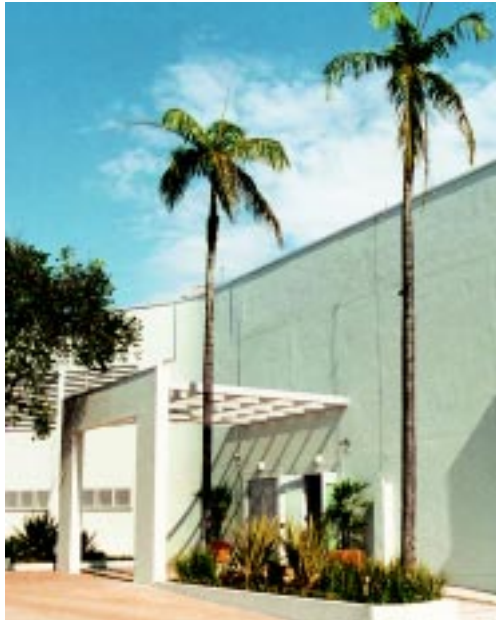
A nova fachada do Centro de Bioterismo

ração do Centro de Bioterismo, que fornecerá matrizes de qualidade para pesquisa em toda a Universidade de São Paulo.