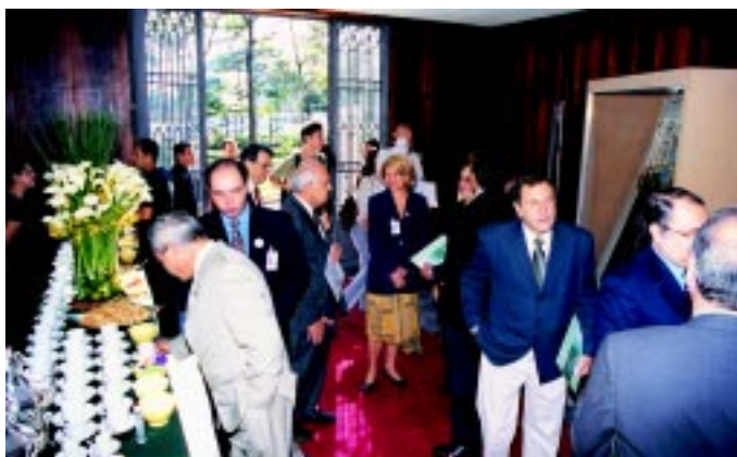
Após a solenidade, os convidados se reuniram em um coquetel no saguão da Faculdade de Medicina.

com a FMUSP/HCFMUSP/FFM. O Hospital deve estar funcionando até novembro. Informou ainda que as obras do Instituto da Mulher devem ser retomadas em 2003 e que este também será entregue ao Complexo.