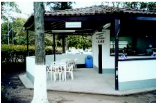
A lanchonete está atendendo às necessidades dos servidores.

No último dia 1º de agosto de 2002 foi inaugurada a lanchonete do Hospital Auxiliar de Suzano, destinada a atender pacientes, funcionários e visitantes.